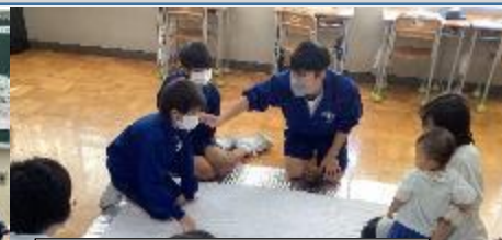
10/2「命の大切さ」1年生道徳授業 実際に赤ちゃんとおふれ合いました。