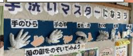
11/28 保健給食委員会の手洗い実験