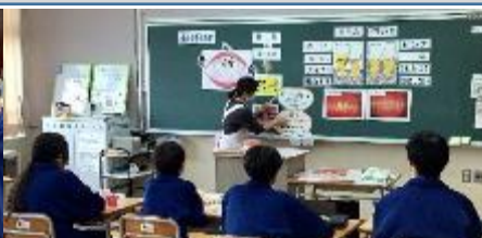
12/2「歯肉炎予防教室」 良い歯の学校の伝統を引き継ぐ。1年生