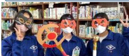
10/30 ハロフェス 2025 仮装でイベントを盛り上げました。図書広報委員会