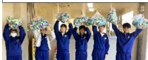
11/4 エコキャップ 16.3 kgをJAさんへお届け。 保健給食委員会