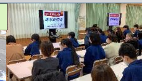
進学説明会（3学年PTAによる司会進行）11/21 2・3年生と保護者が参加。