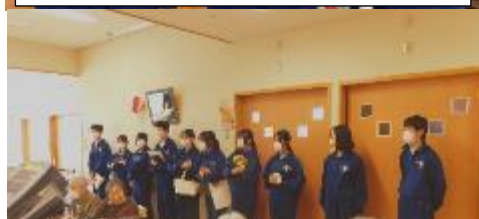
10/29「福祉体験学習」あそか苑での交流会 & 「除雪車出動式」冬の安全をお願いします。2年生