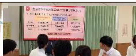
10/1 金融講演会「わたしのライフデザイン」お金と生き方を学ぶ（全校）